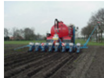
Injectie in één werkgang

Drijfmest in de rij beperkt het effect van lagere gebruiksnormen